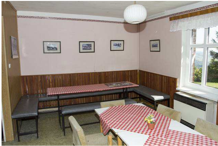
Jídelna s výhledem na závodní tratě foto č. 2 je pořízeno přímo z tohoto okna.